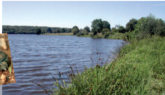
Cariçaie sur étang