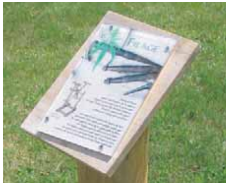
Borne d'information sur le thème du Chanvre

6 Arrivé à la route, tourner à droite et dans le village des Baschauds à nouveau à droite pour rejoindre la D 10. S'engager en face dans l'allée du château qui ramène au bourg. Au niveau du lavoir communal, traverser la route et rejoindre en face le champ de foire.